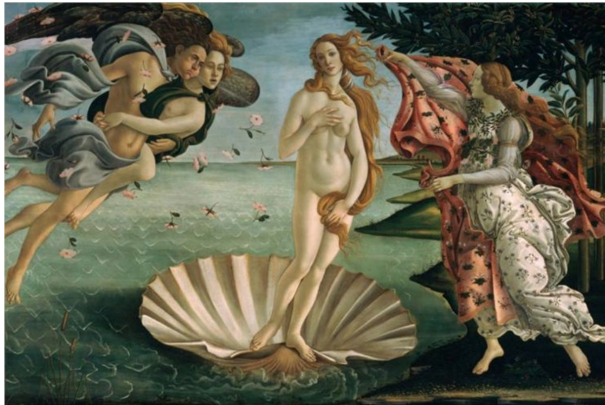
La venus de Botticelli (1486)

“El primero que comparó a la mujer con una flor, fue un poeta; el segundo, un imbécil”. Voltaire.